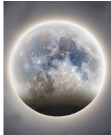
Рисунок 1. Снимок астного лунного затмения 28 октября 2023 года

В описании лунного затмения, произошедшего 28 октября 2023 года, на одном из интернет-сайтов было сказано: «...28 октября произойдет частное лунное затмение. Наблюдать его можно будет примерно в 22 часа, в Северном полушарии оно будет достаточно хорошо видно. Его длительность практически полтора часа. Луна в это время приобретет красноватый оттенок, так как ее частично закроет земная полутень».